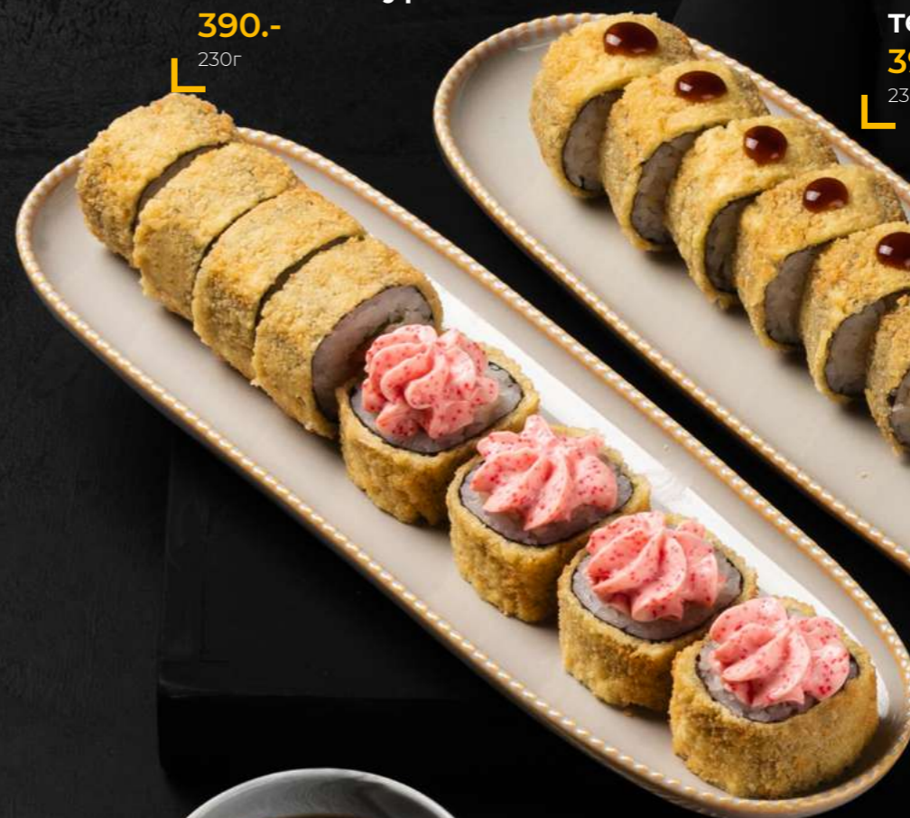
Сяке унаги темпура 390.- 230г