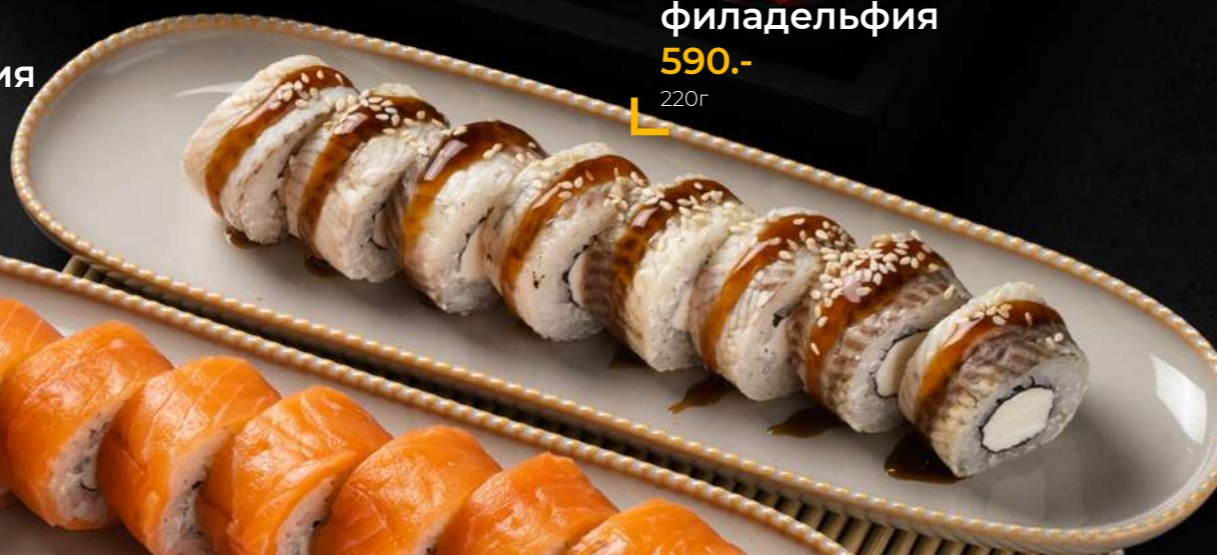
Филадельфия 640.- 220г