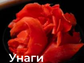
Унаги филадельфия 590.- 220г