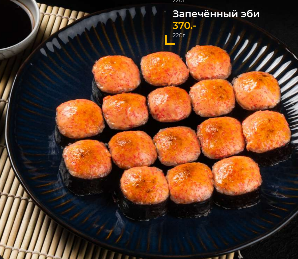
Запечённый эби 370.- 220г